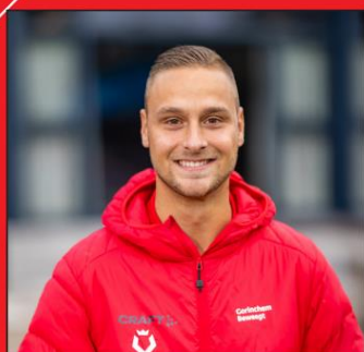
Quincy Bartens Gorinchem Beweegt

° Gorinchem Beweegt is niet verantwoordelijk voor je waardevolle spullen.