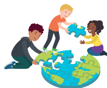
We dragen allemaal een steentje bij

In de bovenbouw hebben de groepen een plan gemaakt waarbij het ging om een steentje bijdragen. Dat is natuurlijk voor iedere klas verschillend. Je kunt er thuis eens naar vragen 😊. De kinderen van groep 8 hebben hun kennis over de democratie verdiept. Zij hebben het onder andere gehad over de rol van de verkiezingen, de regering en de Tweede Kamer.